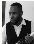
MAGS JANJO MJ Wine Cellars