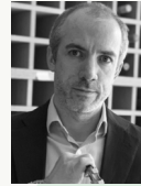
BEANS BOUGHTON MW Alliance Wine